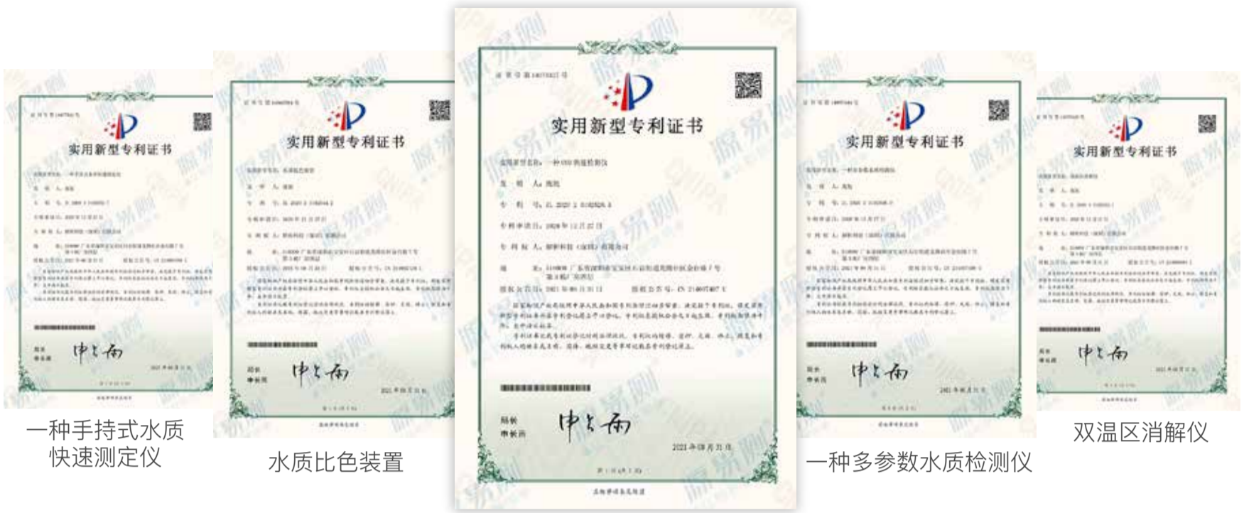
一种手持式水质快速测定仪